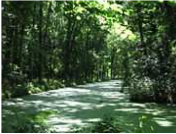
Zie kaartje punt A.

U vaart langs de wijk Roomburg door de spoorbrug. Links is de ingang van park Cronesteyn. Hier kunt u op zomerase dagen heerlijk picknicken of wandelen. De vloten, touwbrug en tokkelbaan in het park zijn een uitdaging voor jong en oud. Park Cronesteyn was het vroegere domein van Kasteel Cronesteyn, een versterkte boerderij uit 1300. Later is het kasteel door brand verwoest en nooit meer opgebouwd.