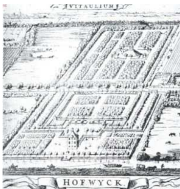
Zie kaartje punt C.

Naast secretaris van de Prinsen van Oranje Frederik Hendrik en Willem I was hij dichter, componist, kustkenner én vader van Constatijn en Christiaan Huygens . Het huis en de bijbehorende tuin zijn symmetrisch gebouwd. De verhoudingen tussen de afmetingen zijn hierbij zeer bewust gekozen. De tuin was namelijk gebaseerd op het menselijk lichaam, waarbij het huis het hoofd vormde met de vensters als oren, neusgaten en ogen. Na de dood van zijn vader Christiaan Huygens heeft nog lange tijd in het huis gewoond. Het huis is in 1849 geveild en voor afbraak gered door Guillaume Groen van Prinsterer een protestants-christelijke politicus die streed tegen ongelof en revolutie.