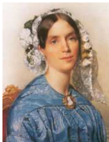
Zie kaartje punt A.

De Wijkerbrug behoort samen met de Kerkbrug, de Nieuwe Tolbrug en de sluizen tot de waterbouwwerken die tussen 1887 en 1894 zijn verbouwd in het kader van de schaalvergroting van de scheepvaart.