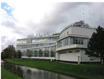
Van Nelle fabriek. Zie A.