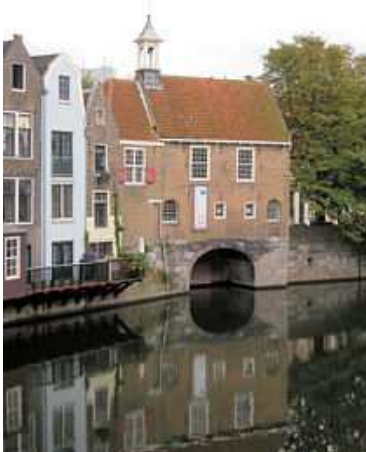
Zakkendragershuisje. Zie kaartje punt B.

De Lage Erfbrug ligt vlak voor de bocht naar de Coolhaven. 100 meter na de brug ligt de haveningang van Delfshaven. Als u een klein schip hebt kunt u in de haven een plaatsje zoeken. Grote schepen kunnen afmeren in de Coolhaven. Dit kan ofwel direct aan bakboordzijde of even verderop aan stuurboord (rechts). Achter de Coolhavenbrug aan stuurboordzijde zijn ook mogelijkheden. 3,9