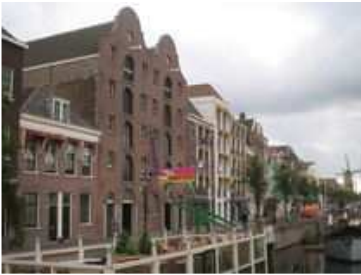
Dubbelde Palmboom. Zie kaartje punt B.

De molens op de kop van de haveneinden zijn de getuigen van een welvarende Jeneverindustrie. De huidige molen 'de Distilleerketel' is gebouwd naast de plek van de oorspronkelijk molen. Deze -in 1899 afgebrande- molen maalde voornamelijk mout tot moutschroot voor de distilleerderijen.