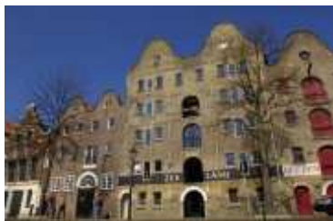
Zie kaartje punt A en B.

Voorbij de sluis, even voor de Appelmarktbrug, ligt het Nationaal Coöperatiemuseum. Net na de brug bevindt zich het Jenevermuseum. Om de musea te bezoeken, kunt u onder andere in de Lange, de Korte of de Nieuwe Haven de trossen vastknopen.