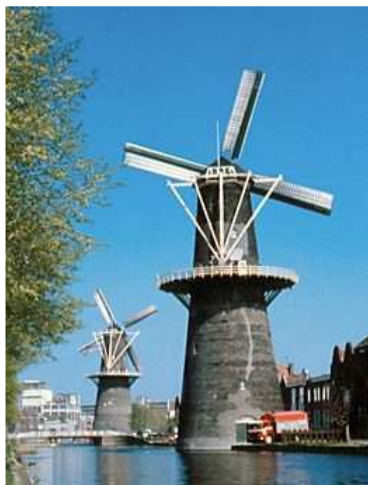
Zie kaartje punt B.

Om de granen voor de jeneverindustrie binnen de stadsmuren te vermalen moesten de wieken van de molen vrij op de wind staan. De molenwieken moesten dan ook boven de bebouwing uit steken. Deze molens worden stellingmolens genoemd.