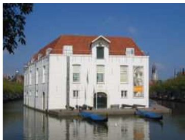
Zie kaartje punt D.

Peper was een van de belangrijkste specerijen met een uitgebreid gebruik, zowel culinair als medicinaal. Peper zou effectief zijn bij depressies, pijn, maagpijn en koorts. Peper was de voornaamste reden om de lange tochten naar de Oost te ondernemen. In sommige perioden werd peper zelfs gebruikt als alternatief voor geld.